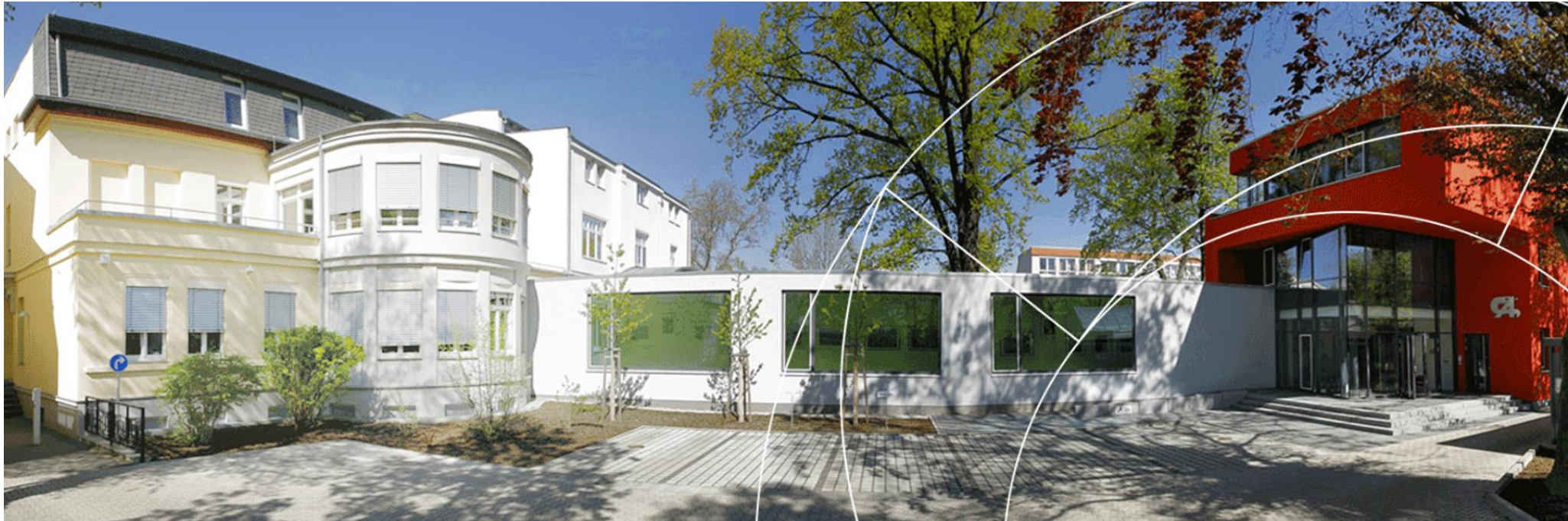
Zentralstelle am Standort der Landesärztekammer Brandenburg in Cottbus